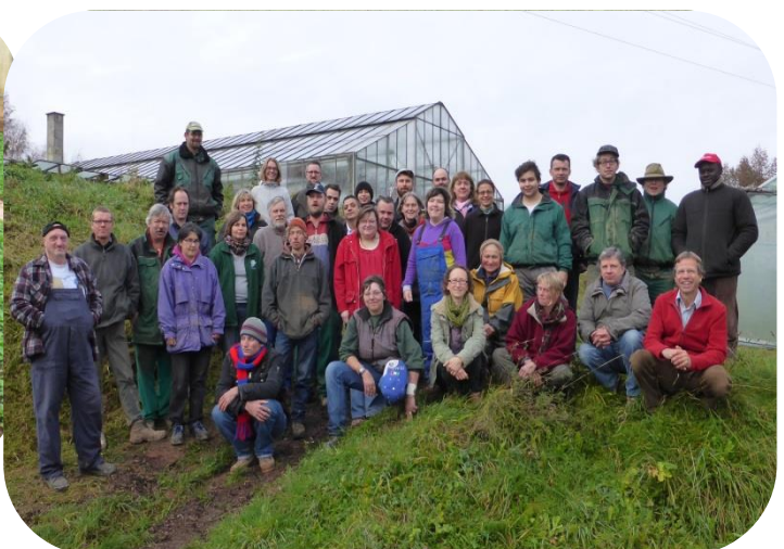
Die Mitarbeiter des Hofes